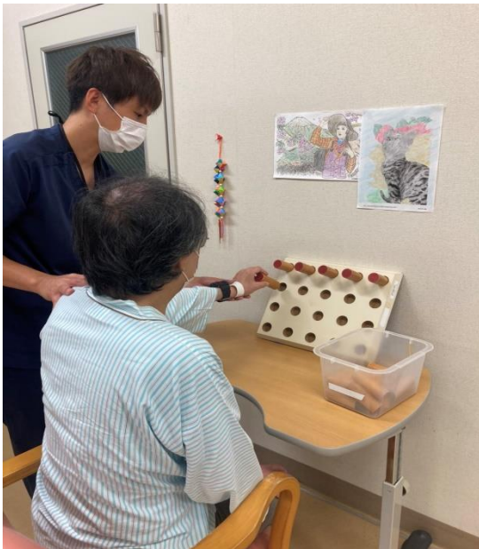
〈作業を用いた機能訓練〉

当院ではまず、患者様の状態を把握させていただく為に、心身機能の評価を実施します。患者様 1 人 1 人の状態に合わせて、作業を用いた機能訓練や日常生活動作への直接的な介入を行っていきます。