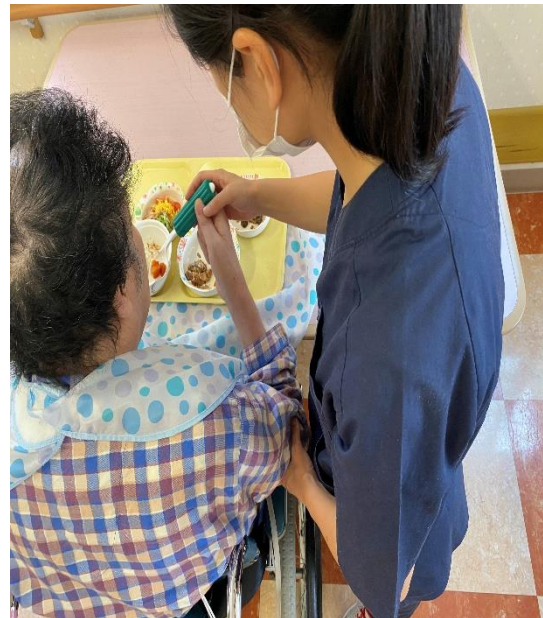
〈日常生活への介入〉

また、趣味的活動や復職に向けた動作訓練なども、患者様のニーズや治療目的に合わせて取り入れていきます。