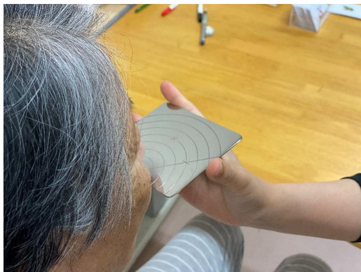
〈訓練室での評価場面〉

当院では、脳血管疾患、呼吸器疾患、がんによる、ことばや飲み込みの障害を対象としています。