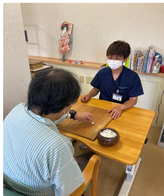
〈趣味的活動を取り入れた治療〉

退院後も生きがいを持ち充実した生活が送れるように、患者様の心に寄り添う医療を提供していきます。