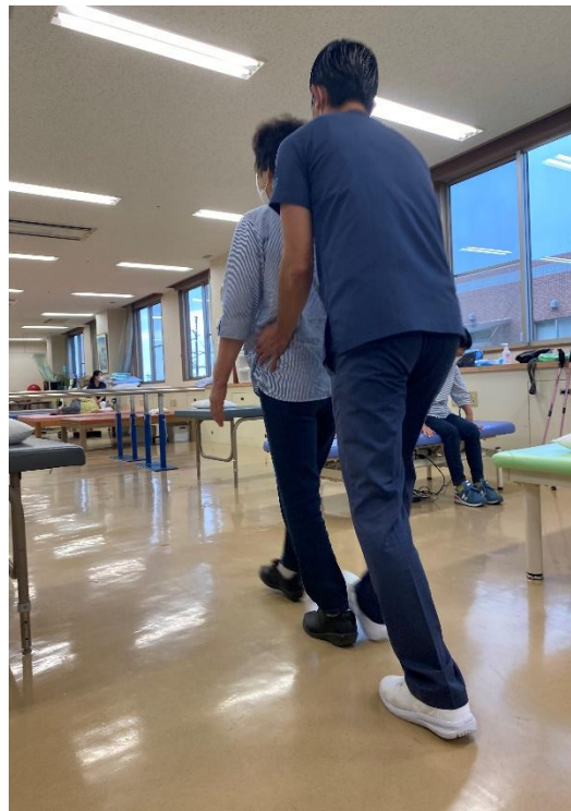
〈訓練室での治療場面〉

当院では、様々な症状で来院される方に対し、原因組織を明確にした上でひとりひとりに合わせた治療及び訓練をさせていただきます。