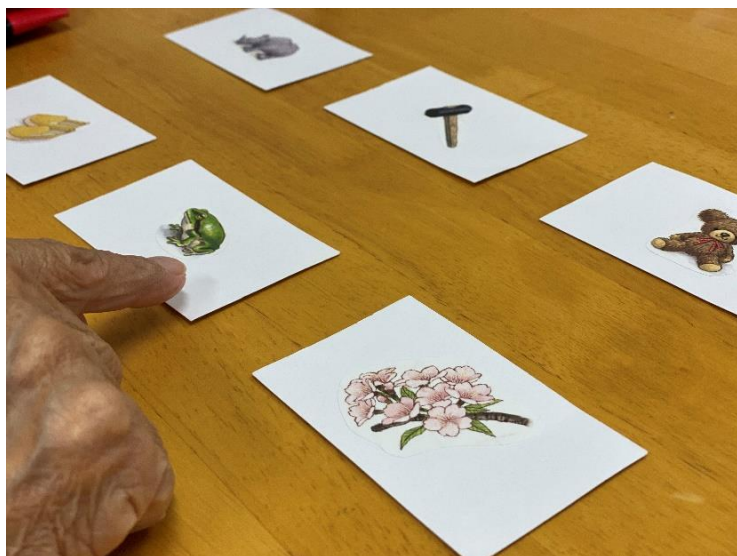
〈訓練室での訓練場面〉