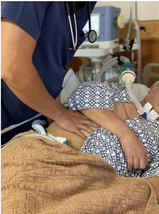
〈病室での治療場面〉