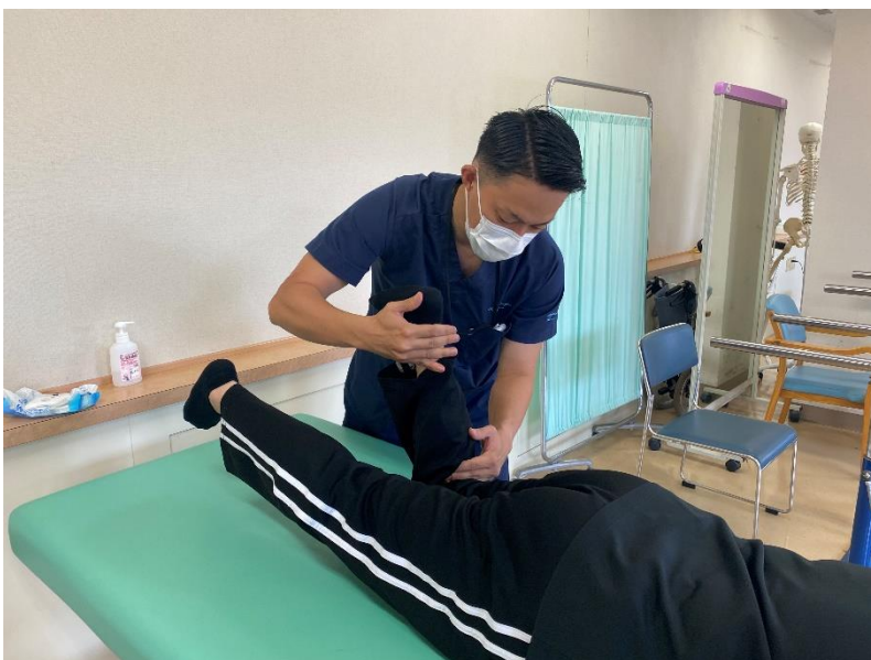
〈訓練室での治療場面〉

当院では、様々な症状で来院される方に対し、原因組織を明確にした上でひとりひとりに合わせた治療及び訓練をさせていただきます。